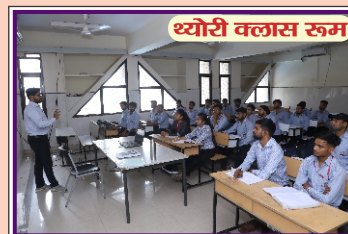
थ्योरी क्लास रूम